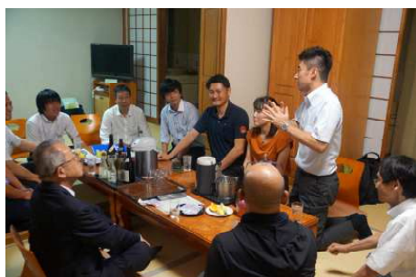
ひざ詰めで地域・農協の未来を語る

開催地は、基幹作目の相次ぐ崩壊の後、少量多品目の周年型産地として再生を果たした群馬県JA甘楽富岡。その実際のオペレーションを現地で学ぶ。インショップ集出荷場にて、「出荷組合員が自分たちで決めたルールを自分たちで守って動くから、JA職員は1人で済む」と聞いて驚く受講生