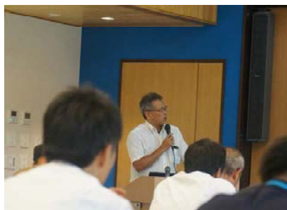
農産物マーケティングの最前線から、充実の講義

営農・販売部門の若手～中堅職員を主対象に、第一線の講師陣が農産物マーケティングの最新事情や要諦を伝授。商品プレゼンを通じて地域の農産物の魅力を実需者に伝える技術も磨かれます。2泊3日の濃密スケジュールで、全国の現場で奮闘する仲間どうしの横のつながりも。